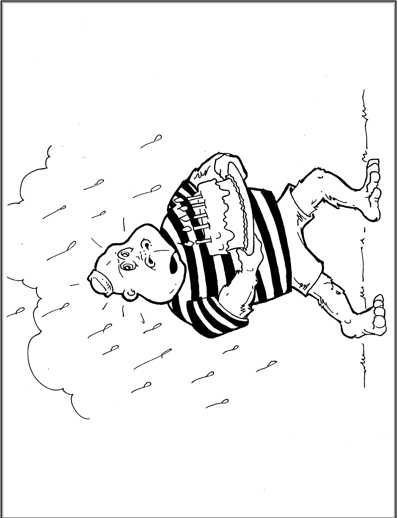
Think Up A Solution - Picture Scene 3

Copyright © 2012 Academic Communication Associates, Inc. Web: www.acadcom.com